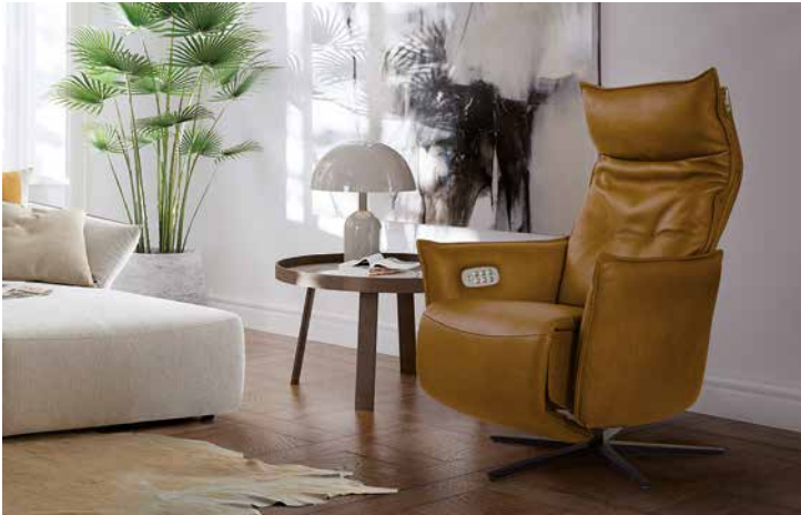
Bezug: Z69/52 kurkuma, mit Modell gin 18250