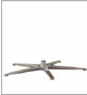
5-Sternfuß versch. Metallfarben 3 Sitzh. - FU1 F 99