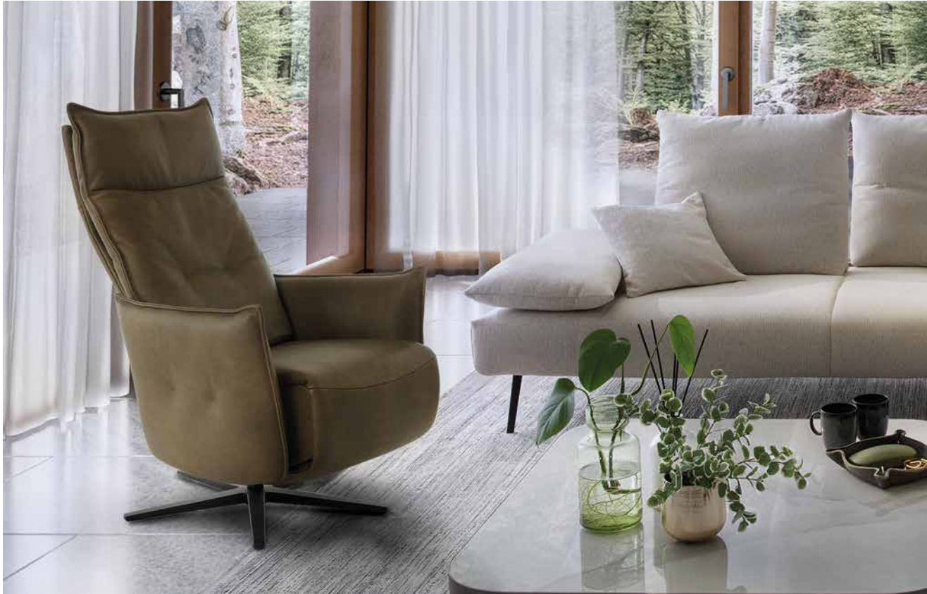
Bezug: Z75/36 camouflage, mit Modell negrooni 16768