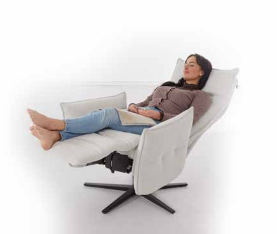
Bezug: R75/43 snow