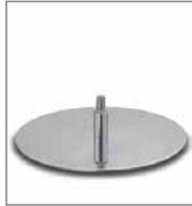
Drehteller versch. Metallfarben 3 Sitzh. - FU2. Auf- F 6Q